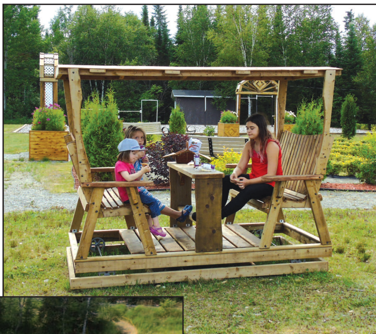
Quatre nouvelles balançoires conçues par un artisan de la

Les passerelles le long des rapides sont terminées et un achalandage accru conforte la municipalité de continuer à être avant-gardiste et visionnaire. Un nettoyage dans les boisés rend la promenade très agréable. Une brise se charge d'apporter l'odeur de la nature et transporte le son de nos joyeux rapides.