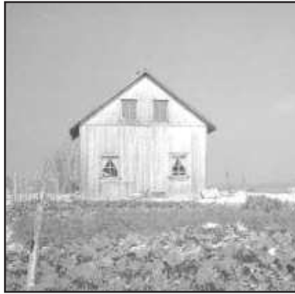
Jardin de monsieur Rosaire Laverdière en 1942.

Il était une fois... il y a très très longtemps... avant de devenir une magnifique municipalité, Preissac était une petite communauté bercée par les flots de ses trois grands lacs.