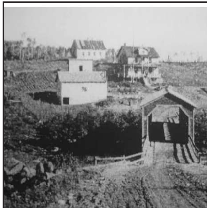
Ancien pont couvert au village de Preissac.

Il était une fois... il y a très très longtemps... avant de devenir une magnifique municipalité, Preissac était une petite communauté bercée par les flots de ses trois grands lacs.